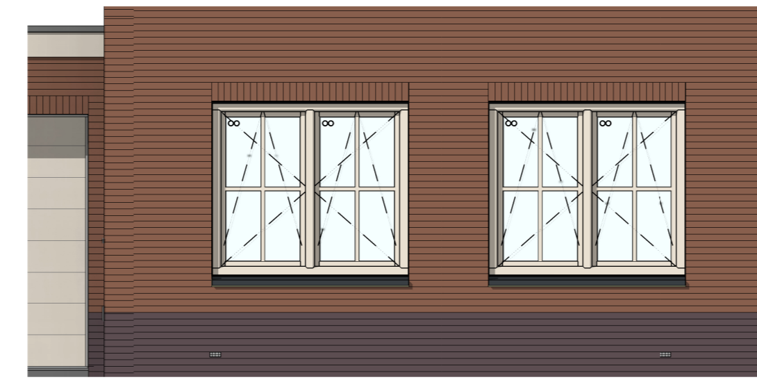
VG5009 - Gevelkozijn met hoge borstwering