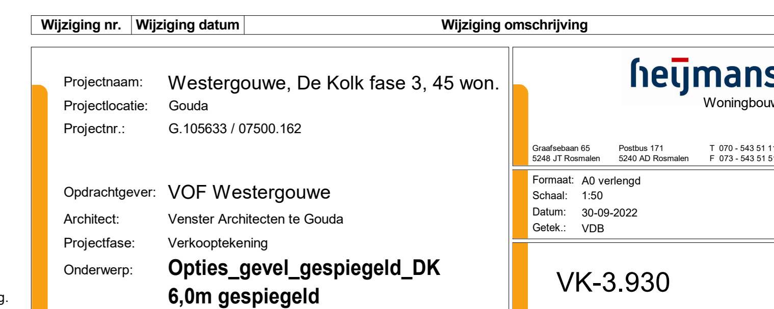
BNR 27, 29 en 34 (gespiegeld)

N.B.: zie voor de indeling en kleurstelling van de basisgevel van de woning uw overzichtstekening.