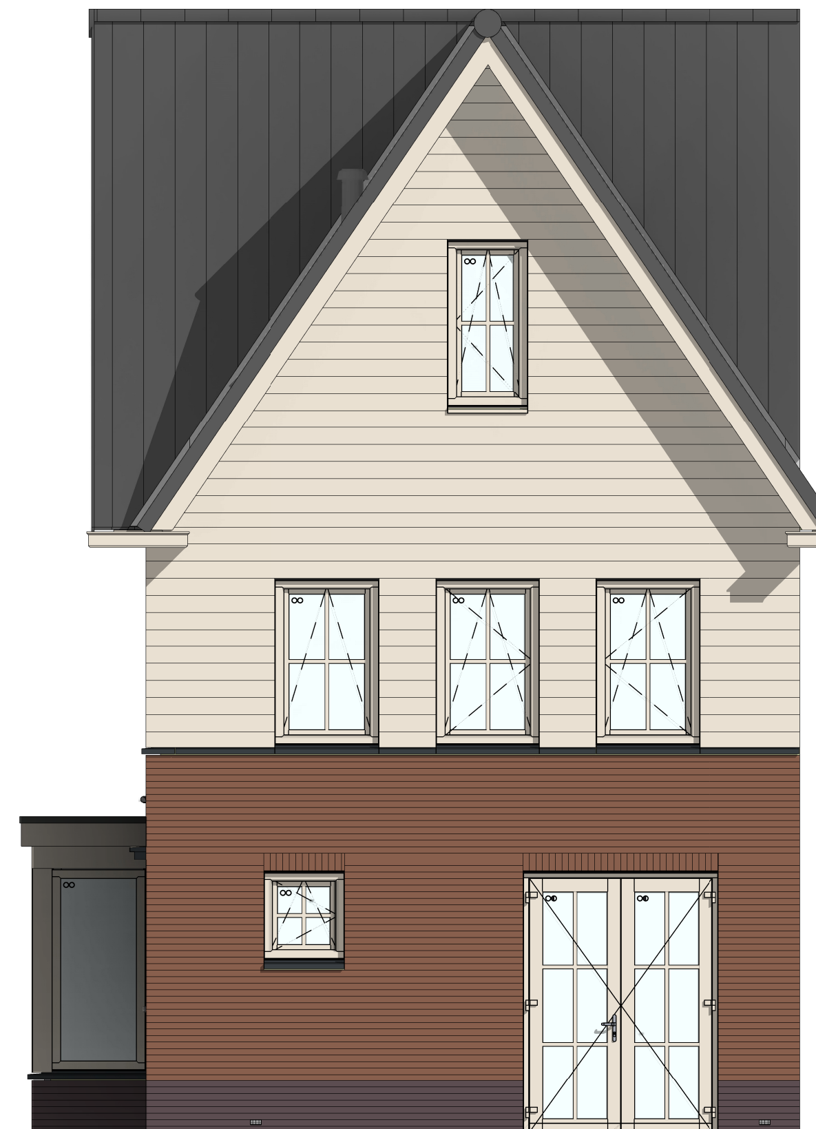
VG5007 - Voorgevel met dubbele openslaande deuren, ipv basisuitvoering met lage gemetselde borstwering