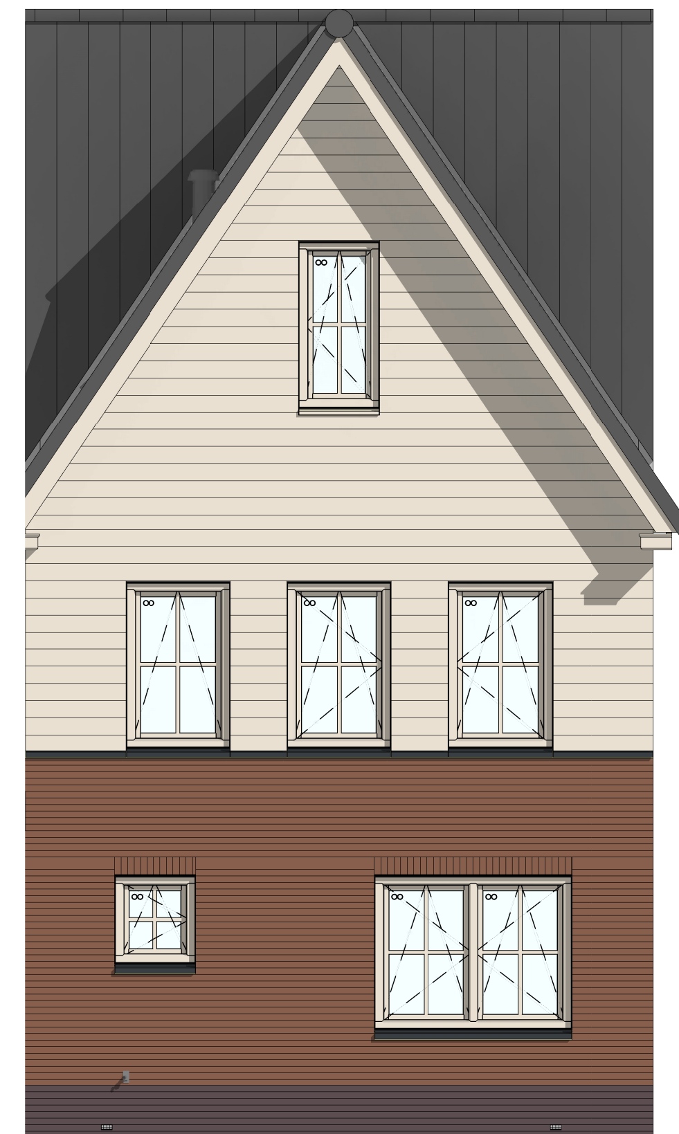
205004 - Buitenkraan in voorzijde zijgevel VG5005 - Voorgevel met hoge gemetselde borstwering, ipv uitvoering met gevelkozijn met lage gemetselde borstwering