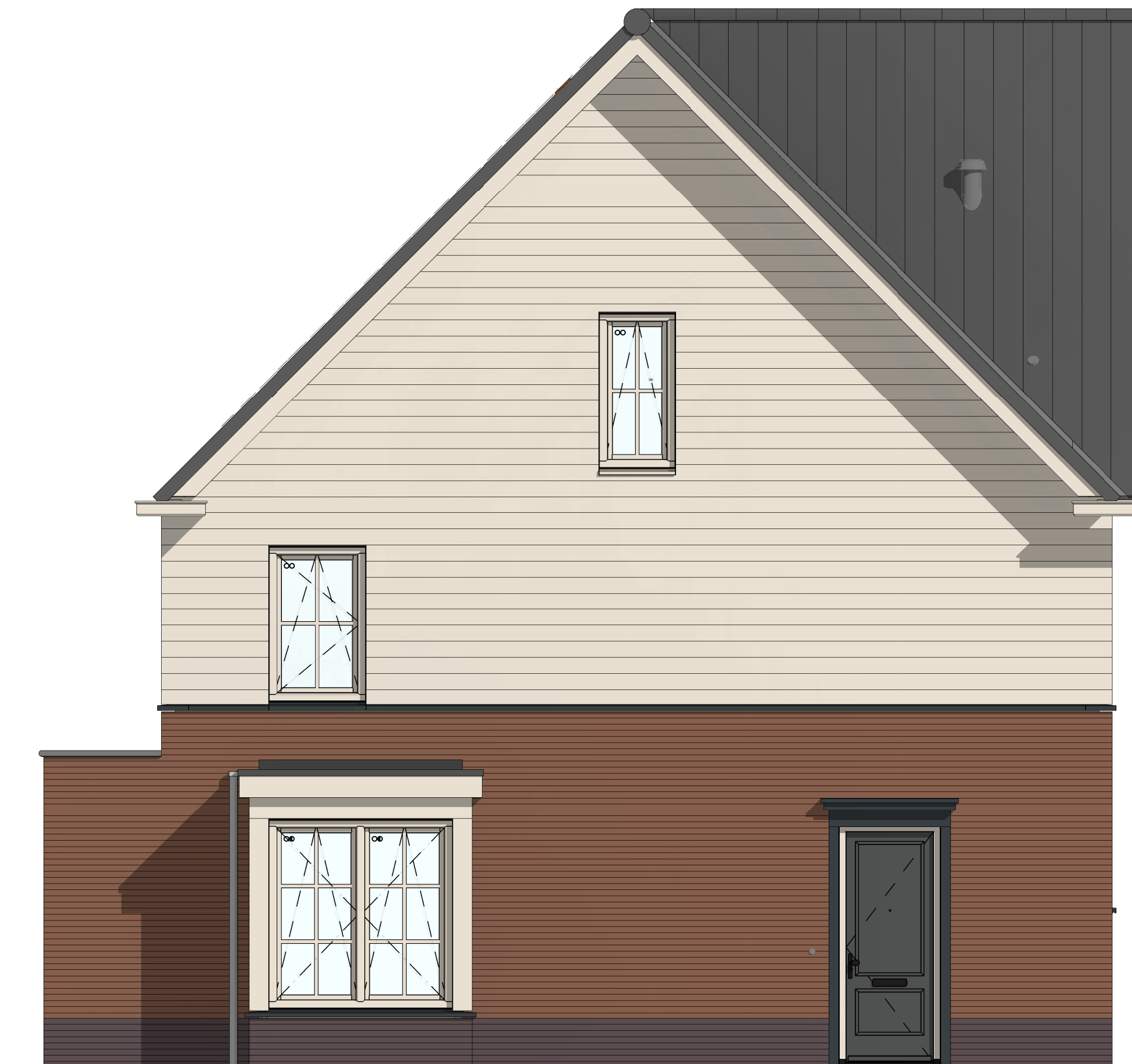
ZG5009 - Erker (klein) tegen zijgevel, bestaande kozijn komt te vervallen Mogelijk voor BNR 1 en 25