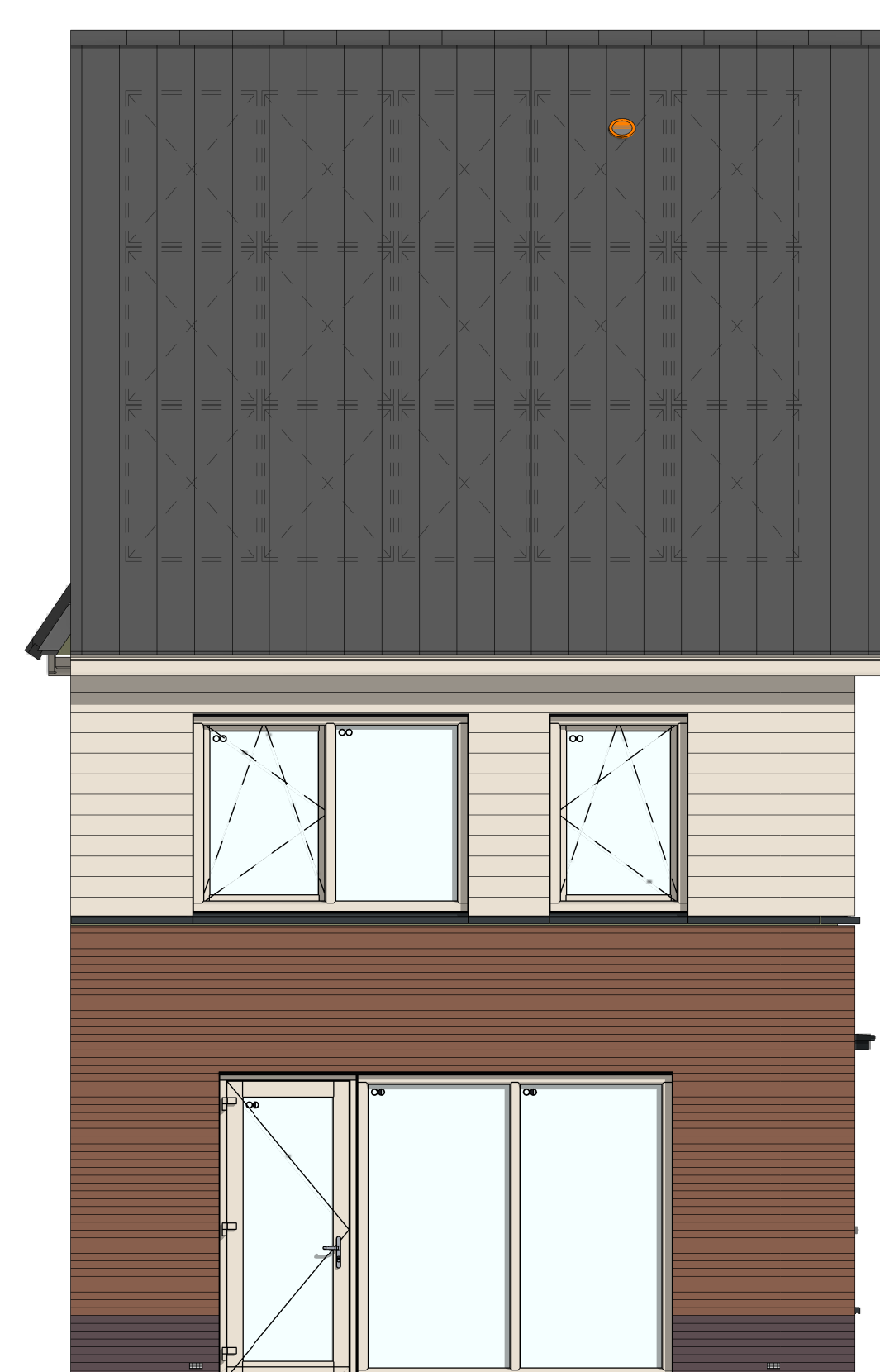
AG5001 - Achtergevel in basis uitvoering