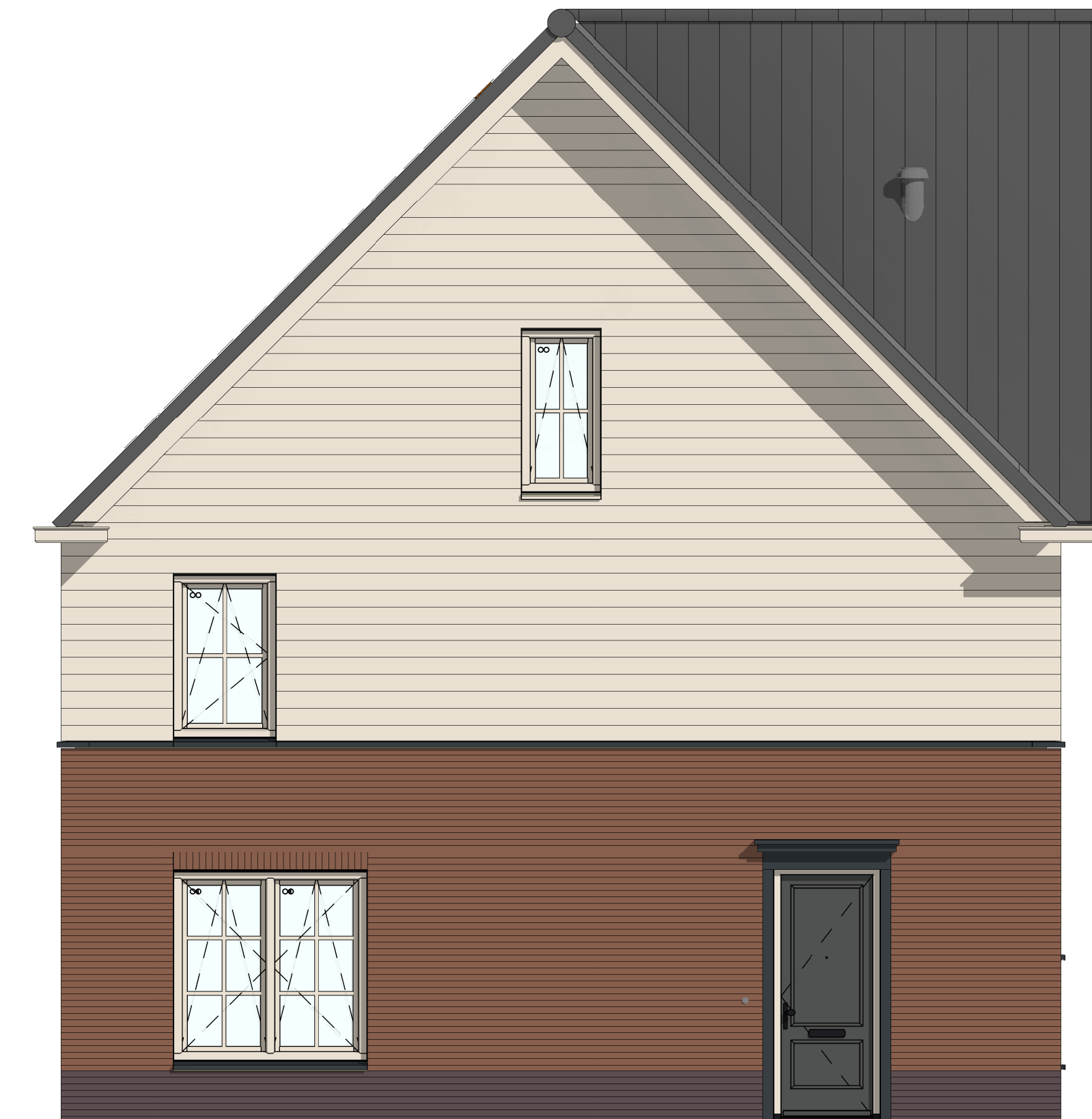
ZG5001 - Zijgevel in basis uitvoering