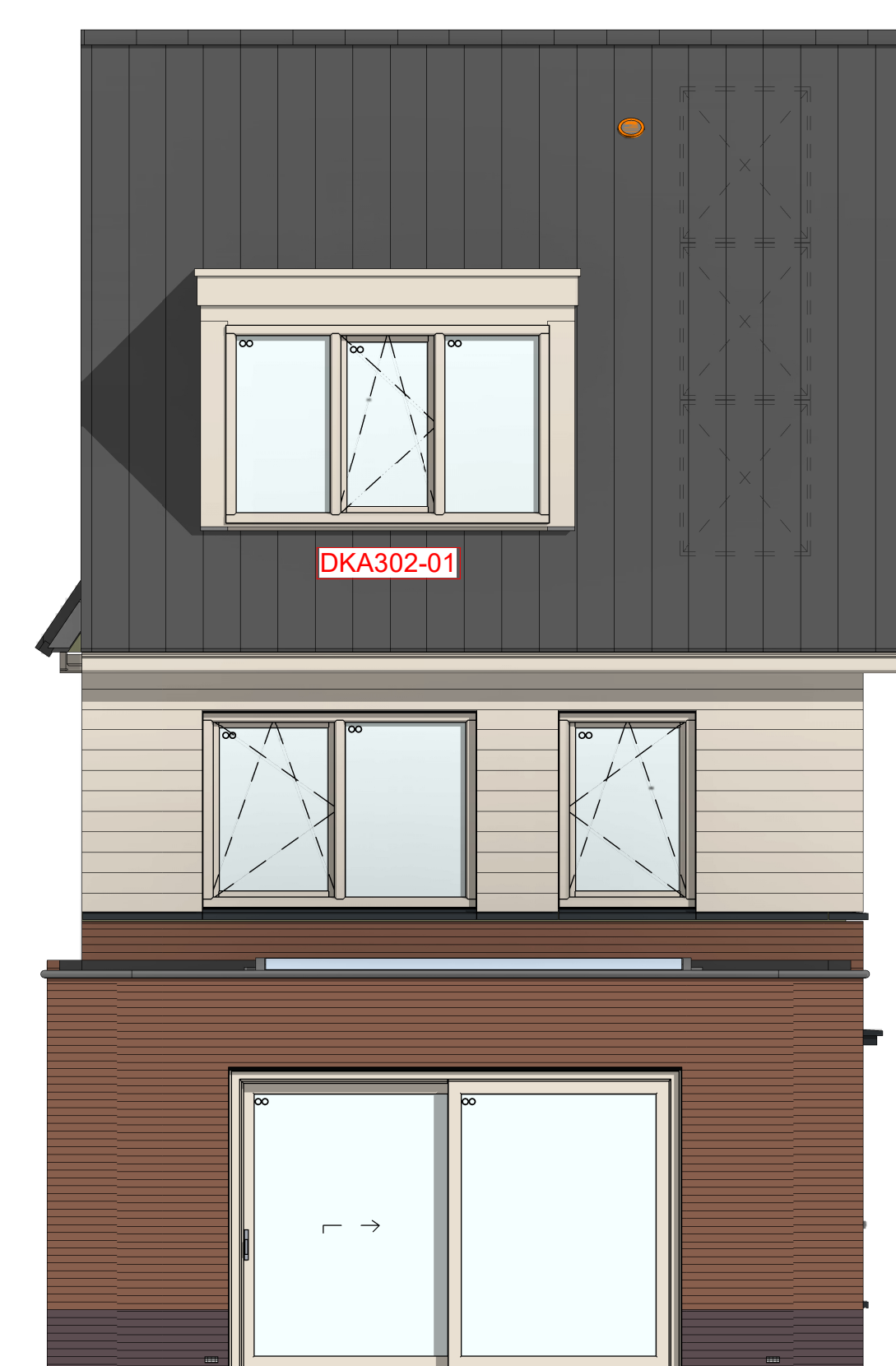
LS6024 - Lichtstraat in aanbouw achtergevel, 2400mm AG5004 - Achtergevel voorzien van schuifpui DKA302-01 - Dakkapel aan de achtergevel 3200x2000mm, met verjongde overstek