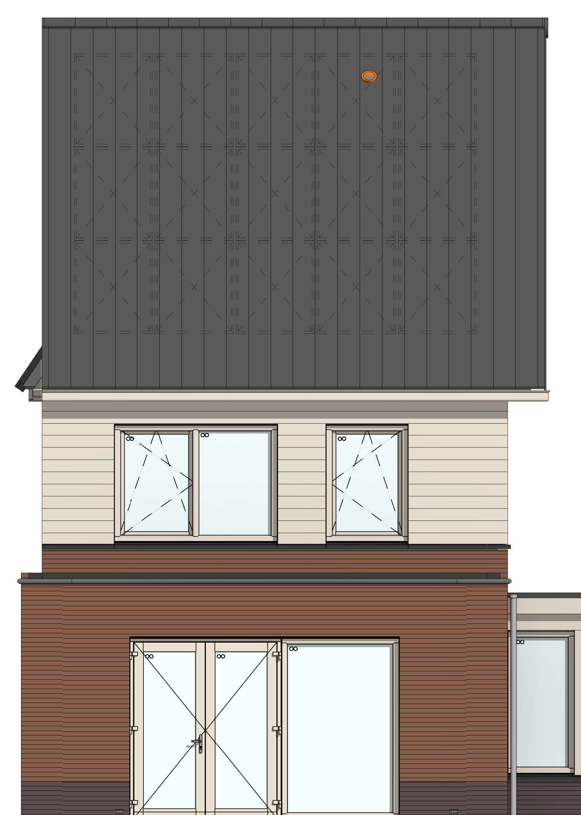
AB6012 - Aanbouw achtergevel, 1200mm AG5002 - Achtergevel voorzien van dubbele openslaande deuren en 1 zijlicht