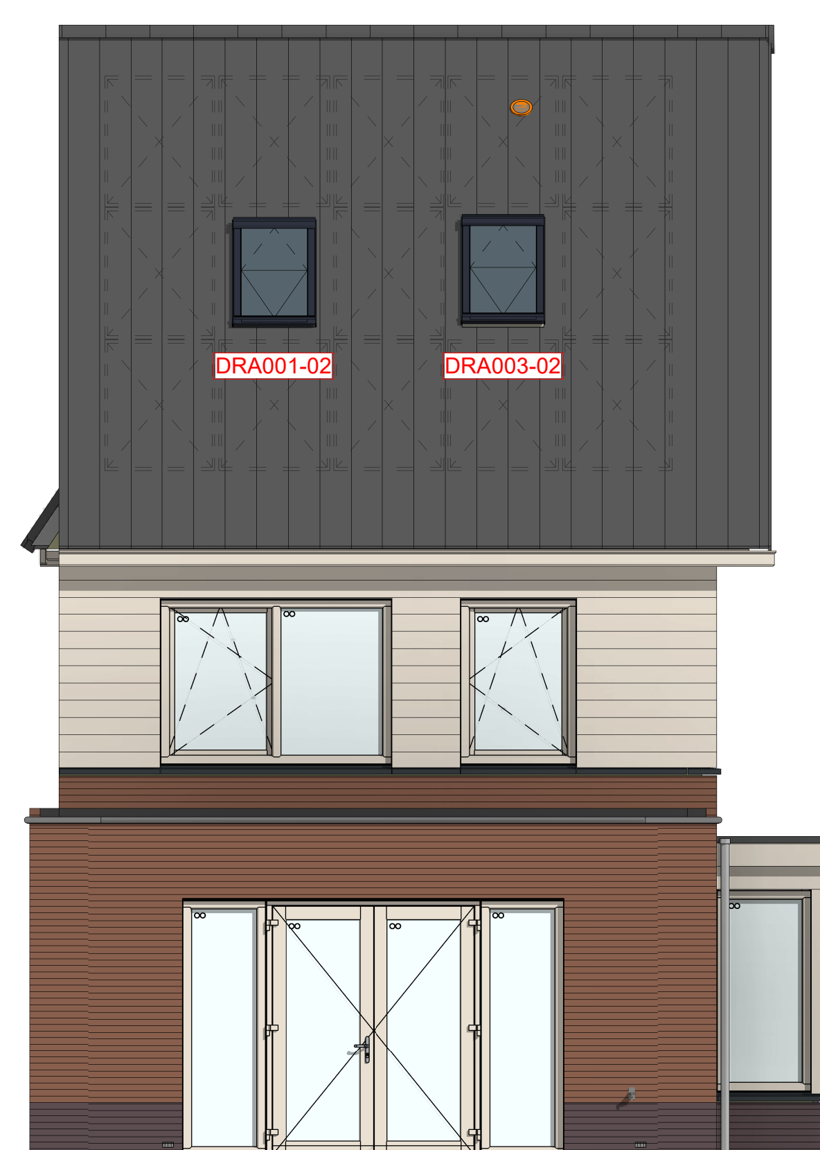
AB6024 - Aanbouw achtergevel, 2400mm AG5003 - Achtergevel voorzien van dubbele openslaande deuren en 2 zijlichten 205007 - Buitenkraan in achtergevel DRA001-02 - Groot dakraam achtergevel (boven slaapkamer 1) DRA003-02 - Groot dakraam achtergevel (boven slaapkamer 3)